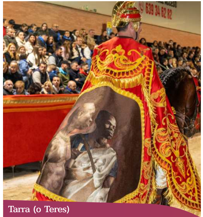
Tarra (o Teres)

El simbolismo de este manto refleja el color rojo de fondo que, además de lo expresado anteriormente, alude a la condena a muerte.