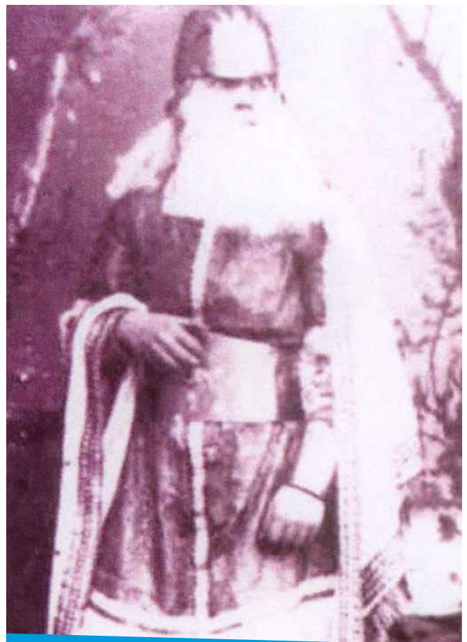
Triunfo de Jefté, El