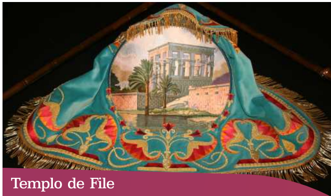
Templo de File