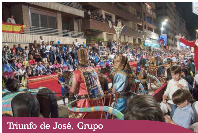
Triunfo de José, Grupo

Formado por siete bigas de estilo egipcio que representan al propio José encabezando el cortejo y van acompañados por esclavos con plumero. Bordados realizados en seda y oro.