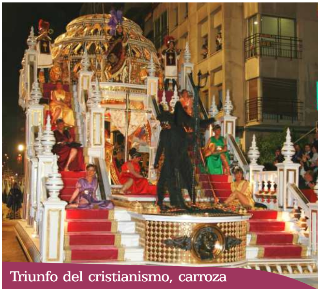
Triunfo del cristianismo, carroza

Se trata de un grupo numeroso, del que en la actualidad se han ido desgajando diversos subgrupos o figuras, llegando a ser el grupo matriz, origen de la mayoría de los personajes que desfilan en la Hermandad de Labradores, Paso Azul. Tiene su fundamento en el Apocalipsis de San Juan, capítulos 19 y 20.