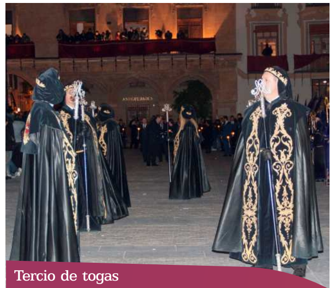
Tercio de togas

Refleja la indisoluble entre la fe y la justicia que resume la identidad de esta cofradía.