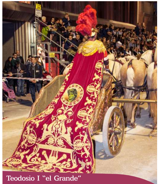
Teodosio I "el Grande"