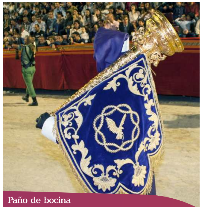
Paño de bocina

Tejido generalmente de terciopelo en forma generalmente semicircular con bordados de oro y sedas, en donde aparece en el centro el escudo de la corporación, escenas de la Pasión, de la vida de María, Santos, etc. Van colocados a modo de mantilla, sujetos por cintas y apliques de orfebrería en los tubos de bocinas, que portan los nazarenos en la procesión.