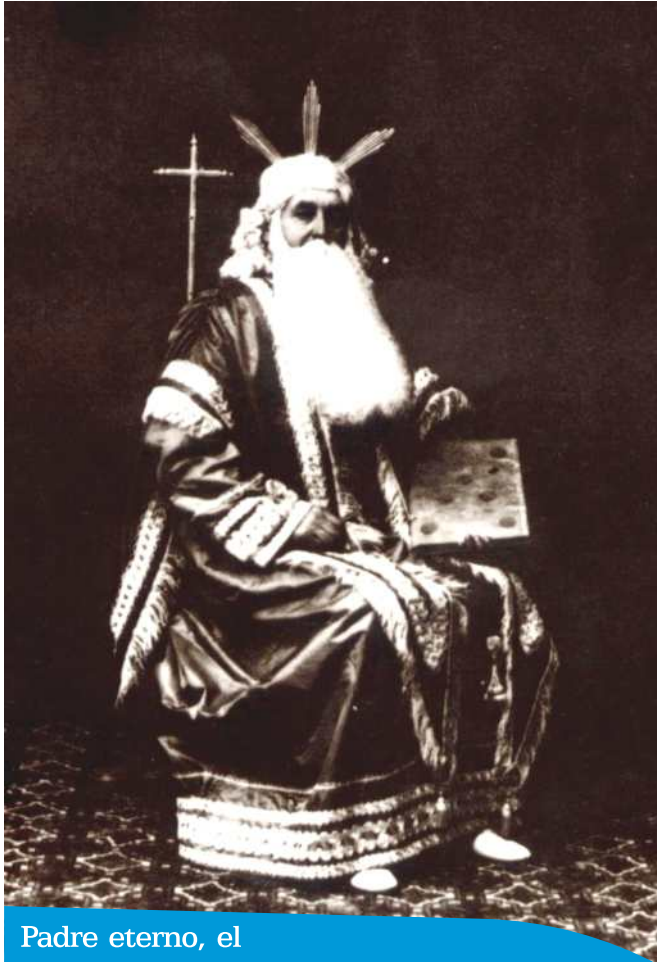
Padre eterno, el

Archicofradía de Nuestra Señora la Virgen de la Amargura. Paso Blanco.