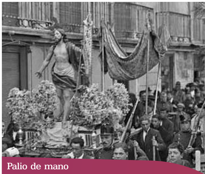
Palio de mano

Llamado también de respeto. Usado comúnmente para llevar bajo él el Santísimo Sacramento o recibir en los templos a las personas que tienen derecho a usarlo. Está compuesto por seis varas de orfebrería, de poco peso, que sujetan en la parte superior un paño suelto a modo de techo, que lleva adosado al mismo unas pequeñas caídas.