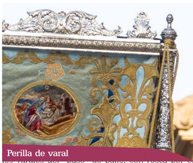
Perilla de varal

inferior para asir a los pernos, afianzando los mismos. También dichas perillas en vez de seguir el orden arquitectónico, las hay de cabezas de querubines, ostensorios, campanarios, ángeles mancebos u otros.