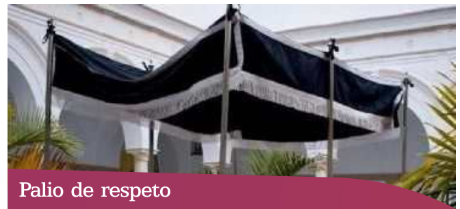
Palio de respeto

que se lleva en las procesiones del Santo Entierro.