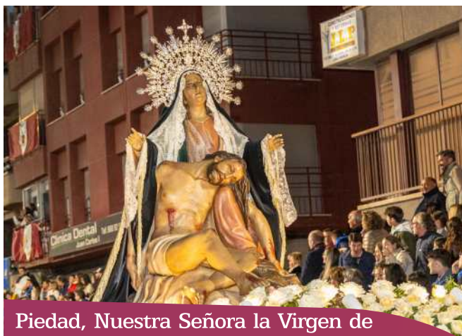
Piedad, Nuestra Señora la Virgen de

Cofradía del Santísimo Cristo del Perdón. Paso Morado. Cortejo religioso. Trono mecanizado.