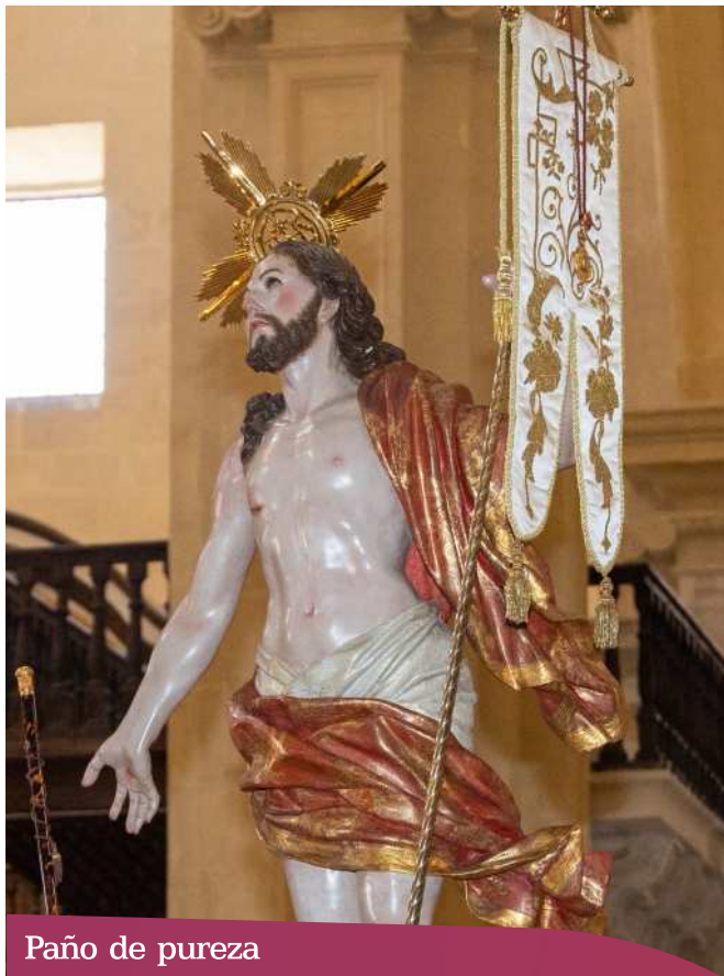
Paño de pureza

“Y Jesús salió del Pretorio y los dos ladrones con él. Y cuando llegó al lugar que se llama Gólgota, los soldados lo desnudaron de sus vestiduras y le ciñeron un lienzo, y pusieron sobre su cabeza una corona de espinas y colocaron una caña en sus manos. Y crucificaron igualmente a los dos ladrones a sus lados, Dimas a su derecha y Gestas a su izquierda”.