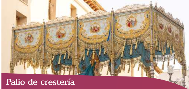
Palio de crestería

Aquellos cuyas bambalinas cuelgan de una crestería de orfebrería, quedando muy sobrio su conjunto.