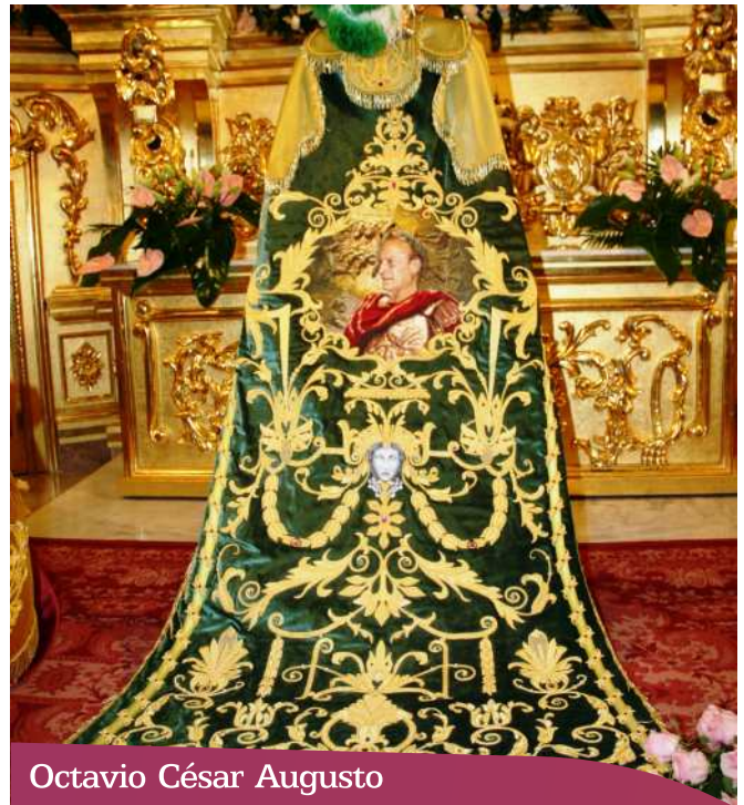
Octavio César Augusto

Cayo Octavio César Augusto (23 de septiembre de 63 a. de C. – 19 de agosto de 14 d. de C.). Se conoció con el paso del tiempo como Octavio (del 63 al 44 a. de C.), como Octaviano (del 44 al 27 a. de C.) y como Augusto (desde el 27 a. de C. hasta su muerte, en 14 d. de C.). Nacido en Roma en el seno de una familia senatorial de segundo orden e hijo de una sobrina de César, quien jugó un papel importante en su educación y permitió acompañarle en algunos de sus viajes. El propio Augusto se enteró estando en Apolonia del