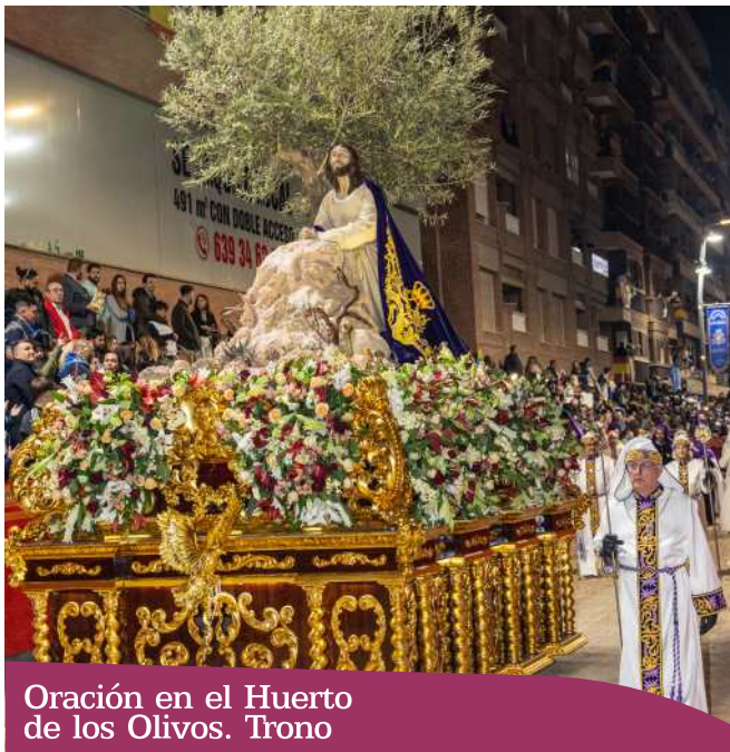
Oración en el Huerto de los Olivos. Trono

Representa el pasaje de Cristo en oración, poco antes de que los judíos procedieran a su detención.