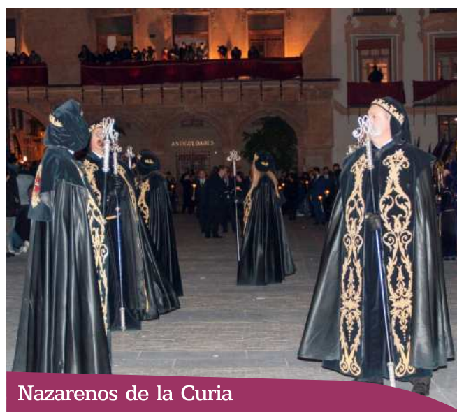
Nazarenos de la Curia

Interesantes túnicas envueltas con una capa que recuerdan las togas que utilizan en los tribunales de Justicia los profesionales del Derecho.