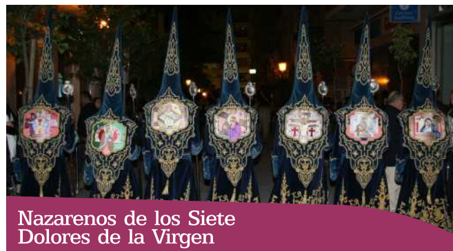
Nazarenos de los Siete Dolores de la Virgen

Representan los siete hitos culminantes de los dolores de la Virgen.