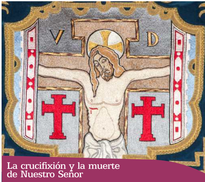
La crucifixión y la muerte de Nuestro Señor

judíos". Muchos judíos leyeron la inscripción, porque donde Cristo fue crucificado era un sitio cercano a la ciudad; y estaba escrito en hebreo, en latín y en griego. Entonces los pontífices de los judíos dijeron a Pilato: "No escribas 'el Rey de los judíos', sino que él dijo: 'Soy Rey de los judíos' ". Pilato respondió: "Lo que he escrito, escrito está".