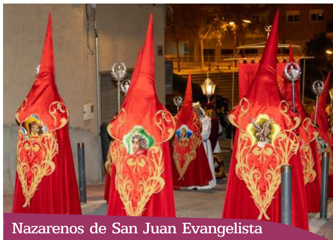
Nazarenos de San Juan Evangelista