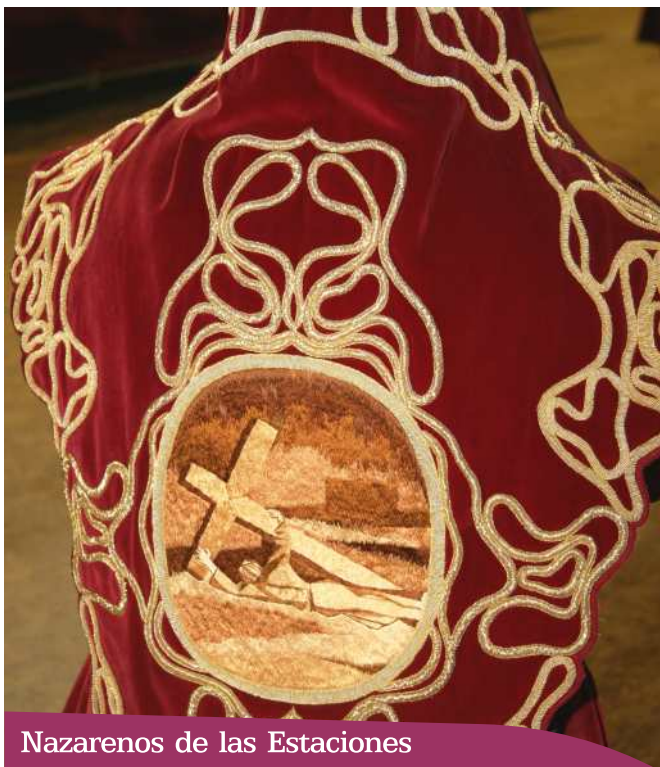
Nazarenos de las Estaciones