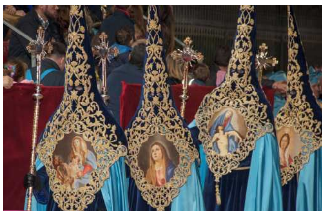
Nazarenos de Nuestra Señora la Virgen de los Dolores