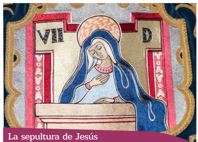
La sepultura de Jesús

Sepultura de Jesús. Después, José de Arimatea, que era discípulo de Jesús, aunque en secreto por miedo a los judíos, pidió a Pilato le dejara llevar el cuerpo de Jesús. Pilato se lo permitió. Fue, y se llevó el cuerpo de Jesús. Llegó también Nicodemo, aquel que anteriormente había estado con él por la noche, con unas cien libras de una mezcla de mirra y de áloe. Tomaron el cuerpo de Jesús y lo envolvieron en lienzos con aromas, como acostumbraban los judíos a sepultar. Había en el lugar donde fue crucificado un huerto, y en el huerto un sepulcro nuevo, donde nadie había sido puesto aún. Allí, pues, a causa de la preparación de la pascua de los judíos, ya que el sepulcro estaba cerca, pusieron a Jesús.