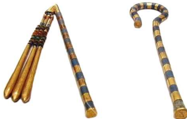
Nejej o Nekhekh

El flagelo Nejej o Nekhekh es el mayal de Osiris, junto con el bastón Heka es la insignia de autoridad. Era muy utilizado en las ceremonias, y aparece con mucha frecuencia asociado al dios Osiris.