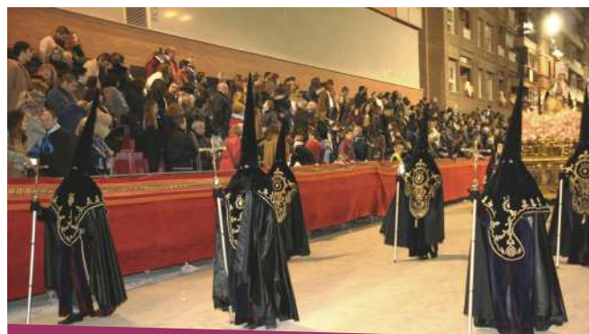
Nazarenos de Nuestra Señora la Virgen de la Piedad

Archicofradía del Santísimo Cristo de la Sangre. Paso Encarnado. Cortejo religioso.