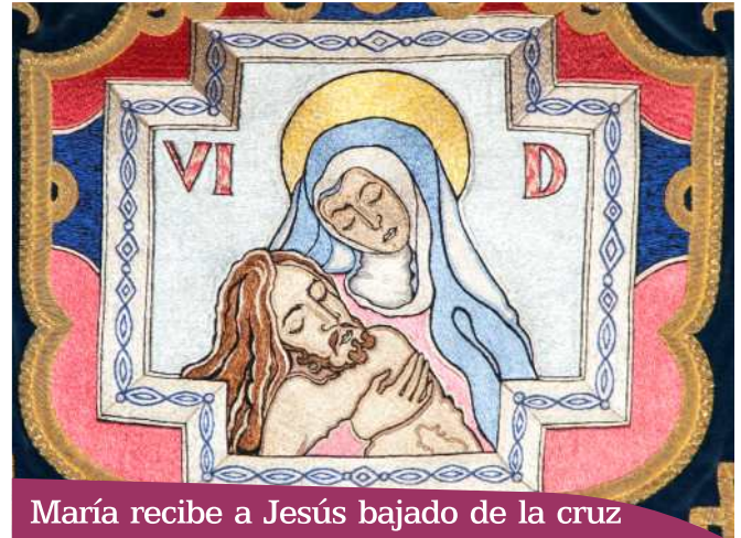
María recibe a Jesús bajado de la cruz

Sepultura de Jesús. Llegada ya la tarde, como era la preparación de la pascua, es decir, la víspera del sábado, José el de Arimatea, insigne miembro del Sanedrín, que esperaba también el reino de Dios, se atrevió a ir a Pilato a pedirle el cuerpo de Jesús. Pilato se admiró de que ya hubiese muerto y, llamando al centurión, le preguntó si había muerto ya. Al saberlo por el centurión, concedió el cadáver a José. Compró una sábana, lo bajó de la cruz, lo envolvió en la sábana y lo depositó en un sepulcro que estaba cavado en la piedra e hizo rodar una losa a la puerta del sepulcro.