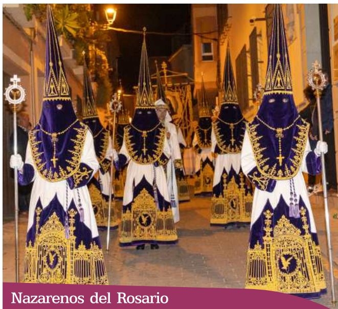
Nazarenos del Rosario

2.006. Debuta este tercio de nazarenos acompañando al estandarte del Rosario abriendo la procesión.