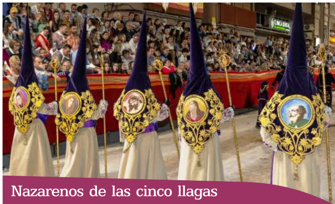
Nazarenos de las cinco llagas

Pedro, María Magdalena, el Apóstol amado, María Santísima y Jesús, el Cristo de la Misericordia. Fueron realizados estos medallones siguiendo la disciplina del bordado lorquino denominado "punto arenilla".