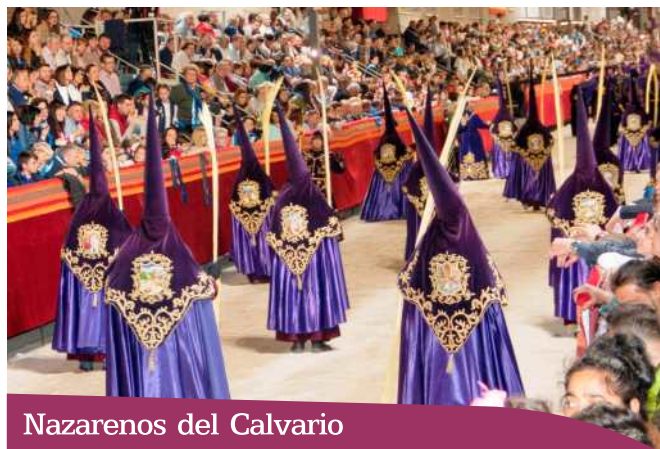
Nazarenos del Calvario