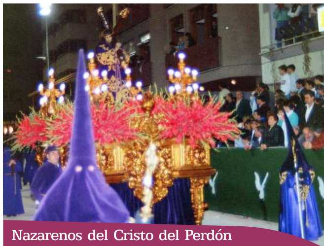
Nazarenos del Cristo del Perdón