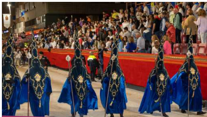
Nazarenos de cierre de la Virgen de los Dolores

La Hermandad de Labradores, paso Azul, cierra su presencia en la carrera lorquina con este tercio de nazarenos que visten túnicas azules, en terciopelo, capas de raso y capirotos azules de terciopelo con bordados en punto de oro en los que unas enramadas de espinas forman una redecilla. En su frontal, unas pequeñas cartelas, en sedas, con la imagen de la Virgen, obra de don Miguel García Peñarrubia del año 1969.