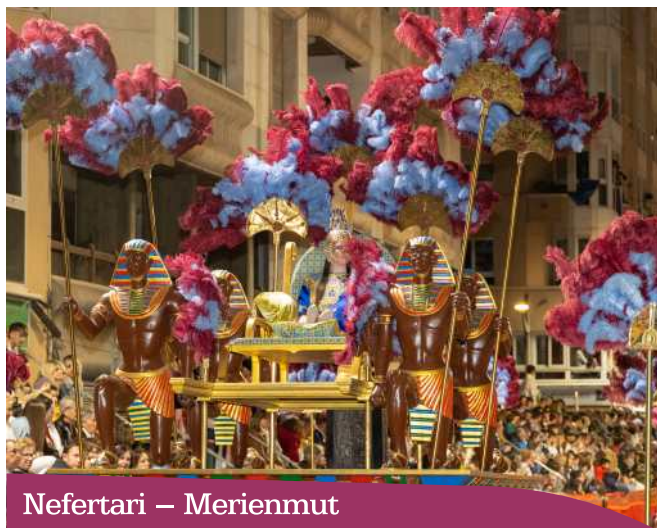
Nefertari – Merienmut