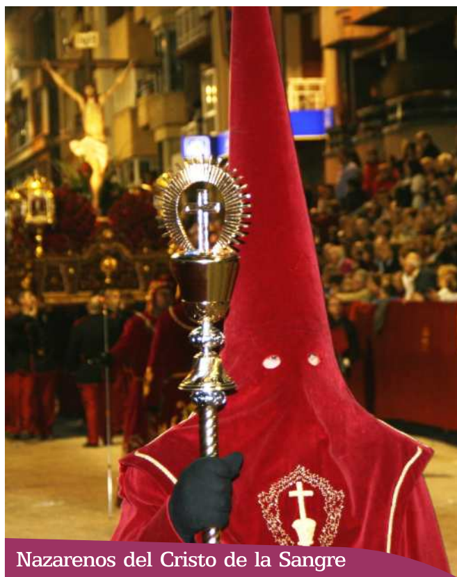
Nazarenos del Cristo de la Sangre