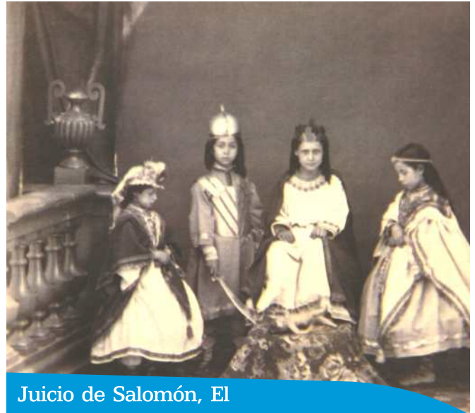
Juicio de Salomón, El

replica: No, tu hijo es el muerto y mi hijo el vivo». Y ordenó: «Traedme una espada». Trajeron una espada al rey, y este dispuso: «Partid en dos el niño vivo y dad la mitad de él a la una y la otra mitad a la otra». Entonces la mujer cuyo hijo era el vivo, sintiendo conmovirse sus entrañas por su hijo dijo: «¡Permíteme, señor mío! Dale a ella el niño vivo, pero matarle... ¡no, que no lo maten!». La otra, en cambio, decía: «No será para mí ni para ti; que lo partan».