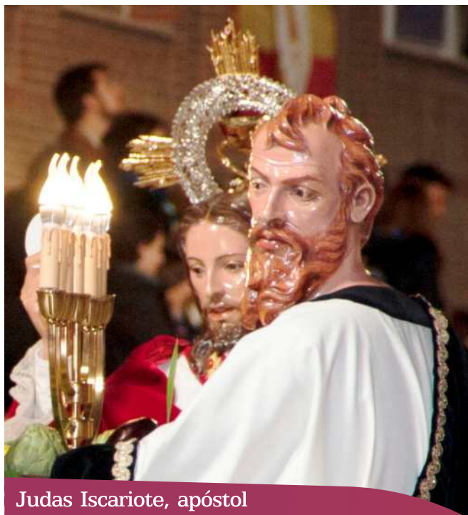
Judas Iscariote, apóstol

Su símbolo apostólico es el lazo corredizo de una horca, o una bolsita de dinero con piezas de plata cayéndose de él.