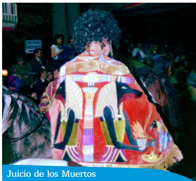
Juicio de los Muertos