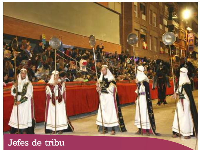
Jefes de tribu