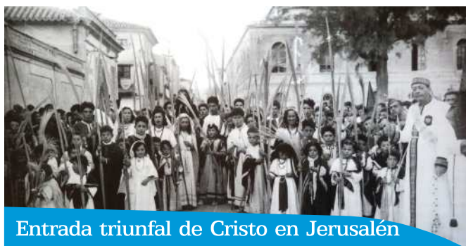
Entrada triunfal de Cristo en Jerusalén

Para más información, ver "Pueblo hebreo"