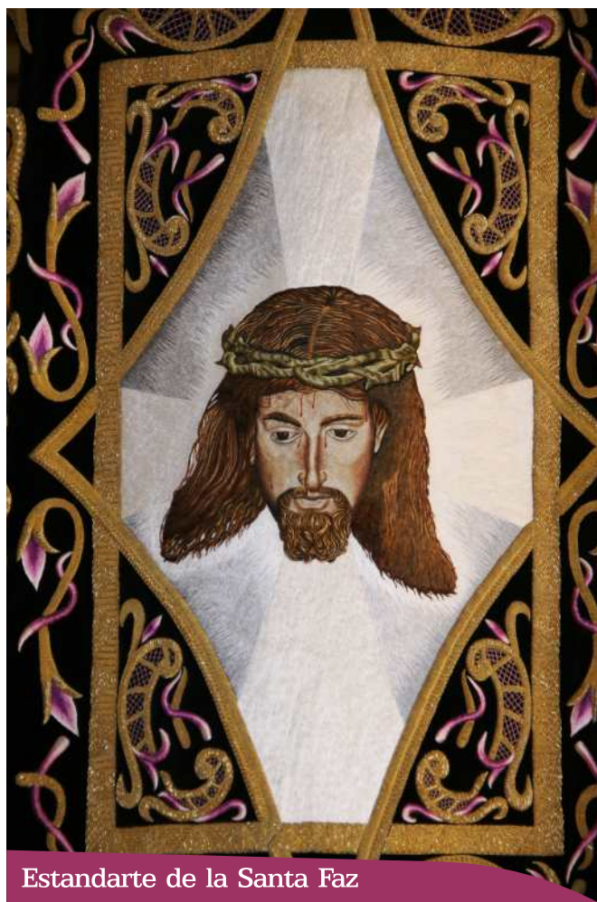
Estandarte de la Santa Faz

Hermandad de Labradores. Paso Azul. Cortejo de la Redención.