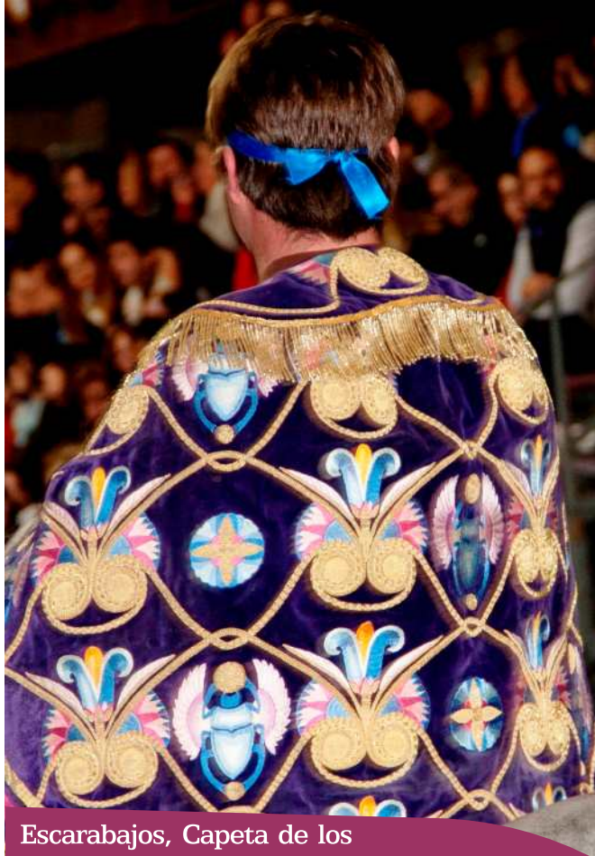
Escarabajos, Capeta de los

alrededor, usado por los eclesiásticos. 3. Pieza del vestido que suelen llevar las mujeres al cuello y sobre los hombros. 4. Pieza sobrepuesta que suele llevar la capa unida al cuello y que cubre los hombros.