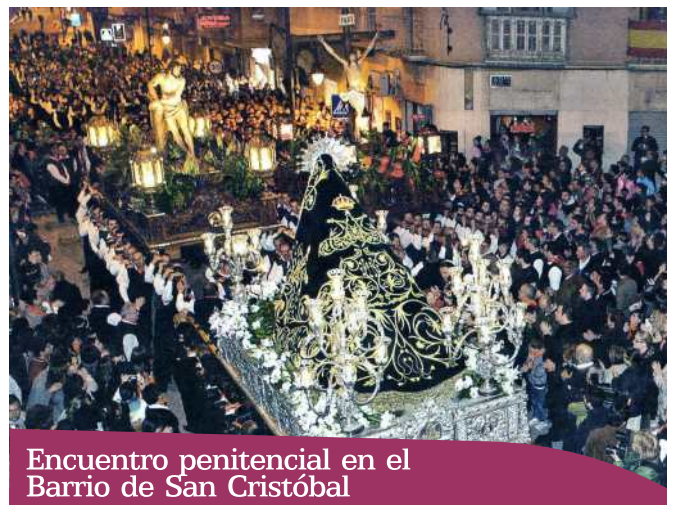
Encuentro penitencial en el Barrio de San Cristóbal

Al llegar la Virgen, durante algunos minutos, las tres imágenes están frente a frente ante el entusiasmo de los asistentes.