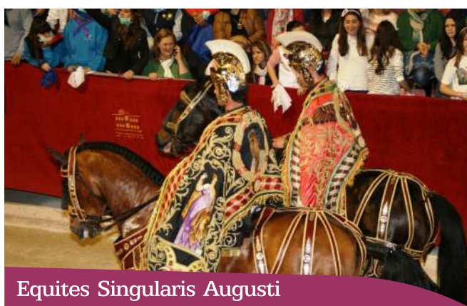
Equites Singularis Augusti

este grupo de jinetes romanos de esta cofradía. Los equites singulares Augusti (literalmente, "caballería personal del Augusto") fueron, durante el periodo del Principado del imperio romano, una unidad militar especial de caballería dedicada a la escolta del emperador siempre que abandonaba la capital. Sus jinetes eran elegidos por su valor, destreza e integridad de entre los que servían en las unidades auxiliares del ejército romano, alas y cohortes equitatas. Además del cuerpo imperial, en las provincias también existían como pequeñas unidades dedicadas a la protección y escolta (guardia de corps) de personalidades y dignatarios romanos, especialmente de los gobernadores provinciales.