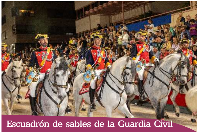
Escuadrón de sables de la Guardia Civil