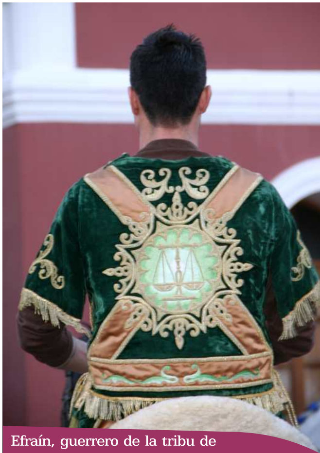
Efraín, guerrero de la tribu de

La tribu de Efraín, junto con las de Zabulón, Neftalí, Benjamín y Majir, estuvieron representadas por los guerreros que rodean a Débora cuando vuelven victoriosos de la batalla de Esdrelón, sobre los ejércitos cananeos, mandados por Sisara al final del siglo XII a. de C.