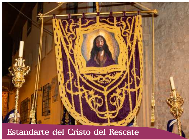
Estandarte del Cristo del Rescate