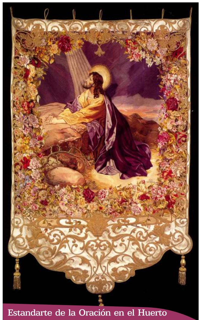
Estandarte de la Oración en el Huerto

Reproduce en sedas el momento en que Jesús se dispone a la oración en el Huerto de Getsemaní.