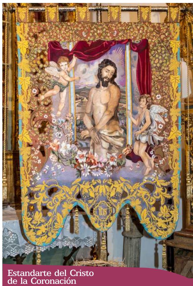
Estandarte del Cristo de la Coronación