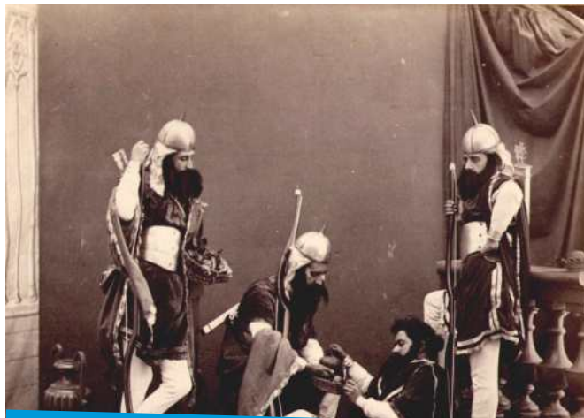
Exploradores en el momento de su regreso del Valle del Racimo o tierra de promisión