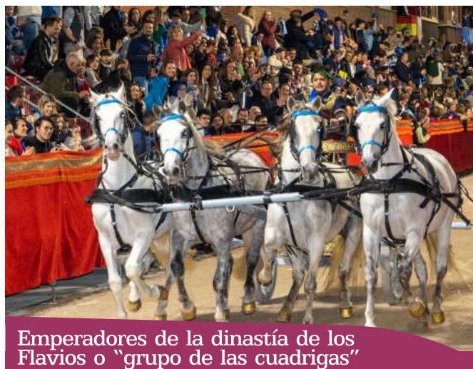
Emperadores de la dinastía de los Flavios o "grupo de las cuadrigas"

Montados sobre carros de carrera y triunfo, tirados por cuatro caballos en línea, representan a los emperadores de la dinastía de los Flavios: Vespasiano, Tito, Domiciano y Flavia Domicia