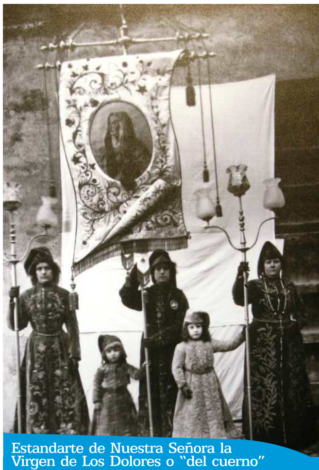
Estandarte de Nuestra Señora la Virgen de Los Dolores o "del cuerno"