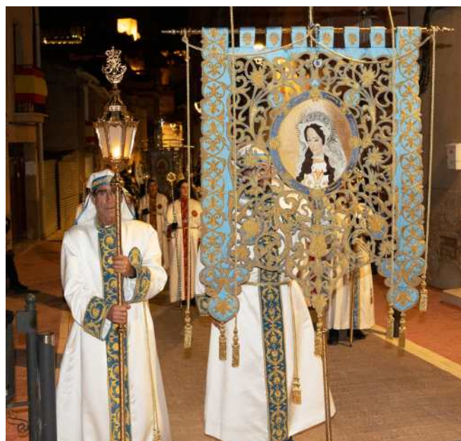
Estandarte de Nuestra Señora la Virgen de la Asunción

2) Procesión del Resucitado el Domingo de Resurrección.