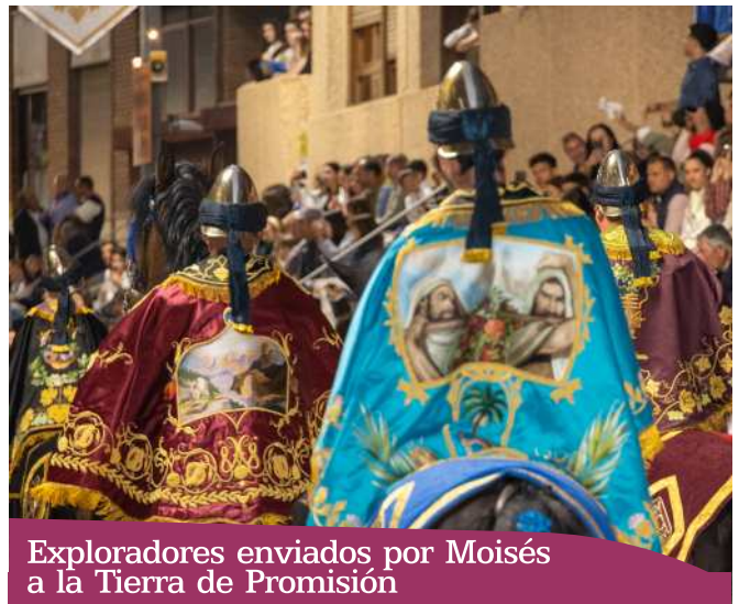
Exploradores enviados por Moisés a la Tierra de Promisión

Jinete 4. Porta manto de un color violáceo y presenta como motivo central una jarra de origen judaico de la que brotan racimos de uva. Esta iconografía también se encuentra enmarcada en el hallazgo de los diversos frutos encontrados, siendo la vid icono fundamental del cristianismo en la vida, pasión y muerte de Jesucristo. Su ornamentación está representada por hojas de parra y uvas, con filigranas decorativas en un marcado estilo modernista. La dirección artística corresponde a don Luis Bastida Gil.