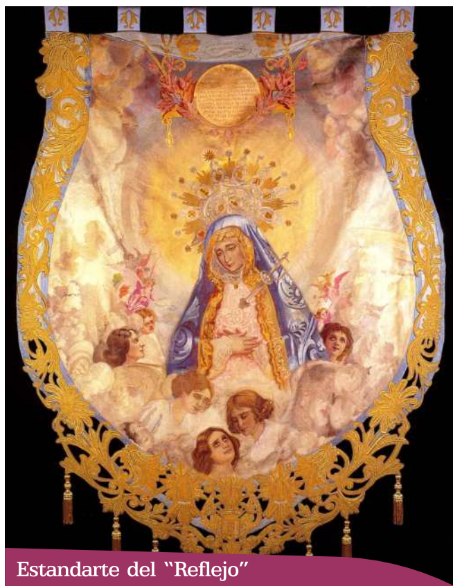
Estandarte del "Reflejo"

del trono de la Virgen de los Dolores y será este estandarte el que, en ausencia de la imagen titular, cierre la procesión azul hasta que en este año se incorpora la nueva imagen de Capuz.