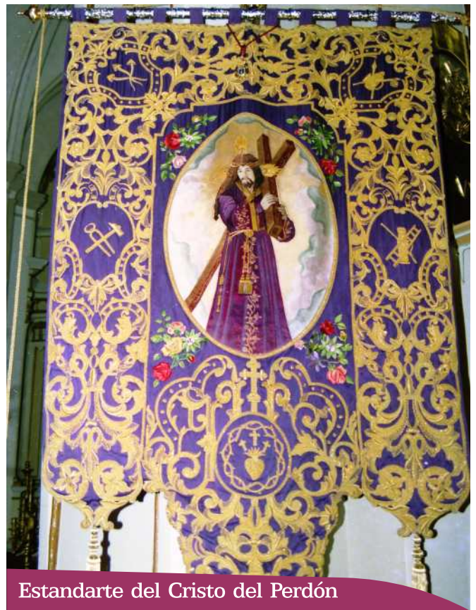
Estandarte del Cristo del Perdón

Cofradía del Santísimo Cristo del perdón. Paso Morado.