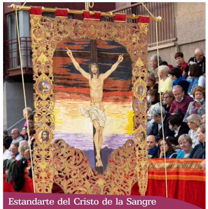
Estandarte del Cristo de la Sangre