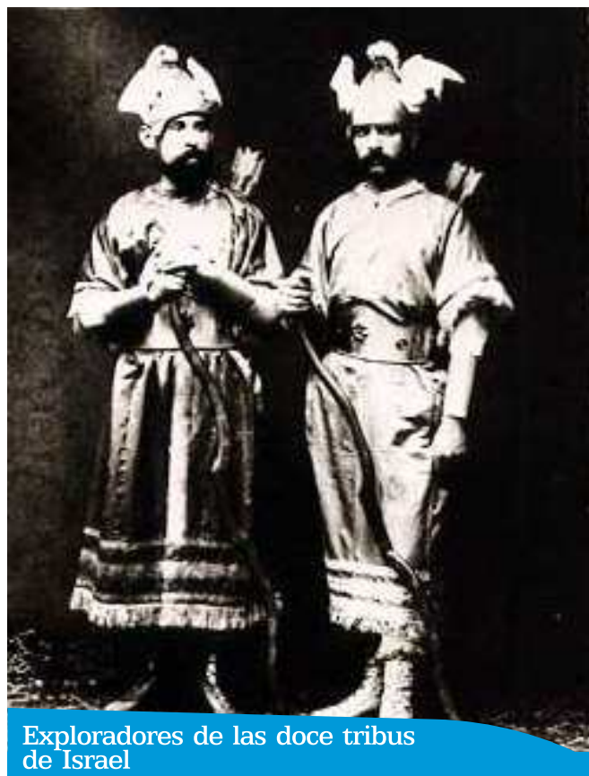
Exploradores de las doce tribus de Israel

1902. Parece que es en este año de 1902 cuando este grupo deja de procesionar dentro del cortejo Blanco