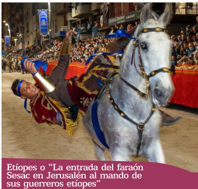
Etíopes o “La entrada del faraón Sesac en Jerusalén al mando de sus guerreros etíopes”