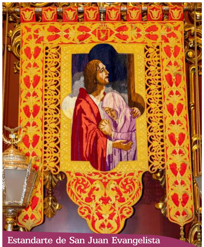
Estandarte de San Juan Evangelista

Muy Ilustre Archicofradía de la Virgen de la Amargura. Paso Blanco. Grupo de la Visión apocalíptica de San Juan.