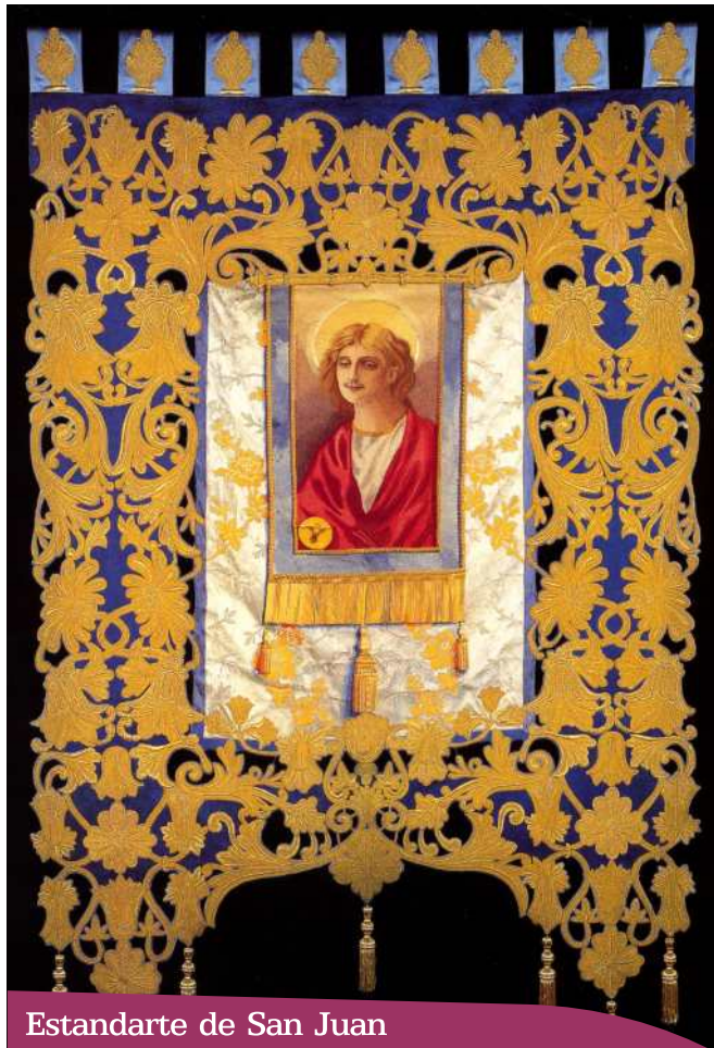
Estandarte de San Juan