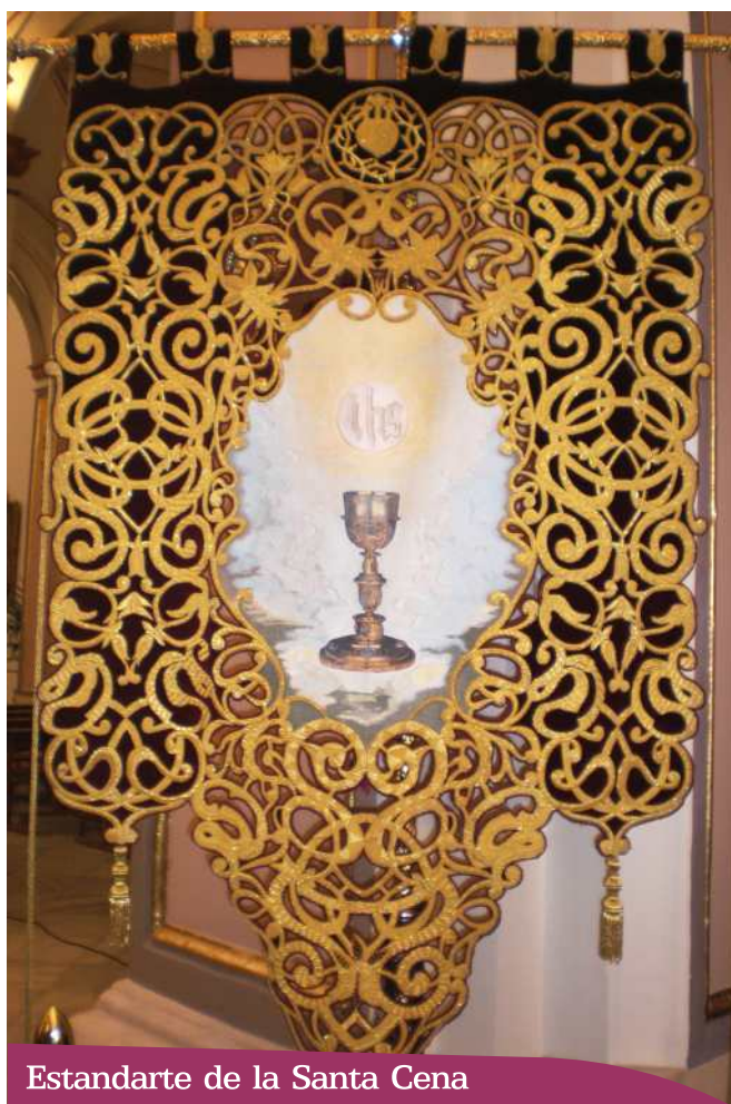
Estandarte de la Santa Cena