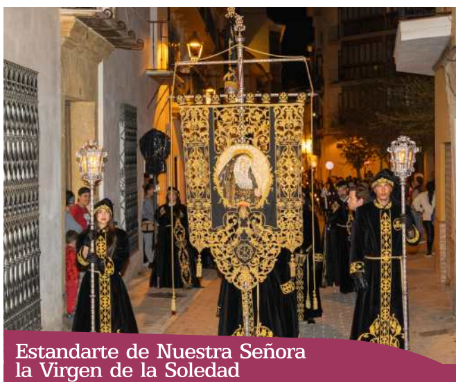
Estandarte de Nuestra Señora la Virgen de la Soledad

Obra sobria y elegante en su composición, con una atractiva orla calada en oro que en el centro exhibe un medallón oval con la efigie de la titular de la Hermandad de medio cuerpo, con las manos enlazadas y vistiendo su manto negro y corona.