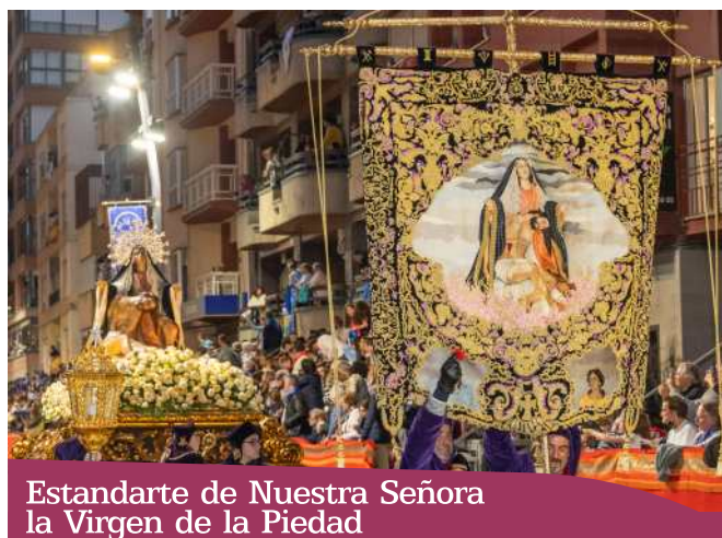
Estandarte de Nuestra Señora la Virgen de la Piedad