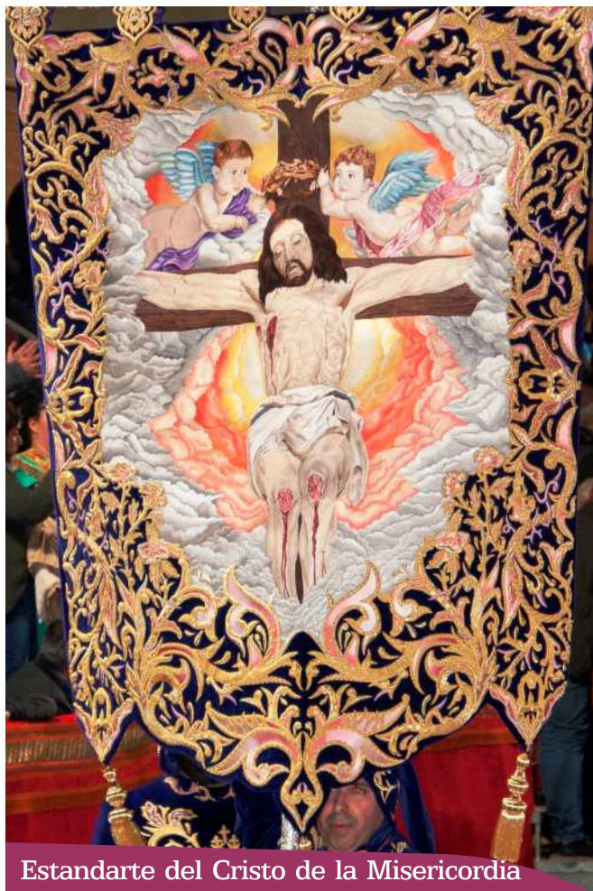
Estandarte del Cristo de la Misericordia