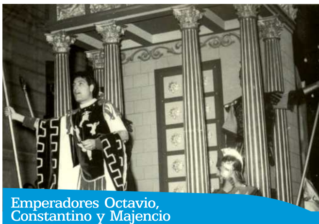
Emperadores Octavio, Constantino y Majencio

Está compuesto por una carroza dedicada en su parte delantera al emperador Octavio, fundador del imperio romano. Se representa con esta carroza alusiva al imperio romano, en su parte delantera el Templo de Jano, uno de los dioses de la mitología romana, expresando el momento en que el emperador Octavio cerró dicha casa de oración para declarar la paz universal, precisamente en el momento del nacimiento de Cristo. Figuran en ella, el emperador con sus consejeros Mecenas y Agripa, acompañados de soldados de la guardia. Ante una reproducción del templo capitolino, aparece el emperador en actitud de arenga, vestido con rico peto de terciopelo verde, bordado en oro y manto granate de terciopelo. La parte posterior de la carroza, dedicada a Constantino, simboliza el momento en que éste, en vísperas de la batalla de Puente Milvio, invoca al Dios de los cristianos, que le hiciera conocer su madre. Ante la aparición de una cruz en el cielo, con el lema "In Oc Signo Vincis", Constantino aparece arrodillado, cubierto con un amplio manto de terciopelo verde, bordado en oro, en cuyo centro destaca una cruz de fuego realizada en seda. Acompaña a la figura orante, dos muchachas sencillamente vestidas que representan a las vírgenes cristianes, que estuvieron unidas a Constantino en su oración por la victoria.