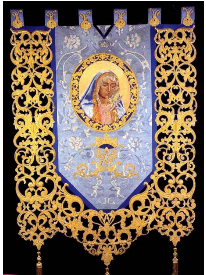
Estandarte de Nuestra Señora la Virgen de Los Dolores

de un paño central de forma rectangular finalizado en punta, bordado en sedas y orlado de una greca calada en punto de oro de inspiración barroca, formada por sinuosos motivos vegetales, concretamente por hojas de acanto.