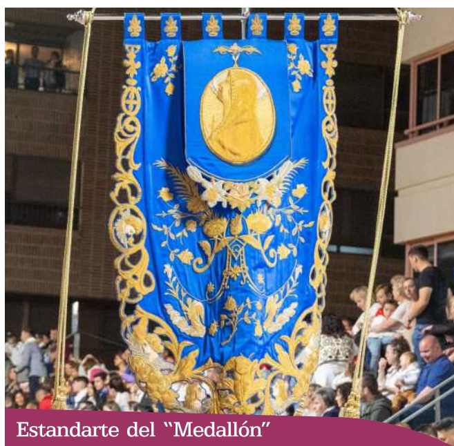
Estandarte del "Medallón"