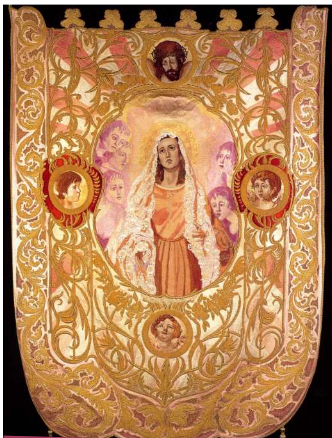
Estandarte de Nuestra Señora la Virgen de la Amargura