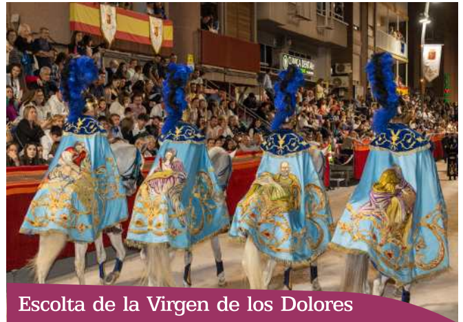
Escolta de la Virgen de los Dolores

Compuesta por cinco jinetes que representan a los cuatro evangelistas, San Mateo, San Marcos, San Lucas y San Juan, junto al arcángel San Gabriel. Su desfile es solemne, en señal de respeto a la Santísima Virgen de los Dolores a la que escoltan.