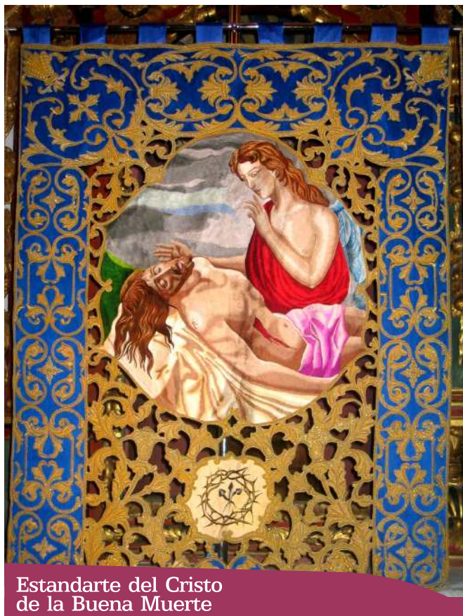
Estandarte del Cristo de la Buena Muerte

Bordado en sedas y oro se representa al Cristo yacente y antecede al trono del Cristo de la Buena Muerte o Cristo Yacente.