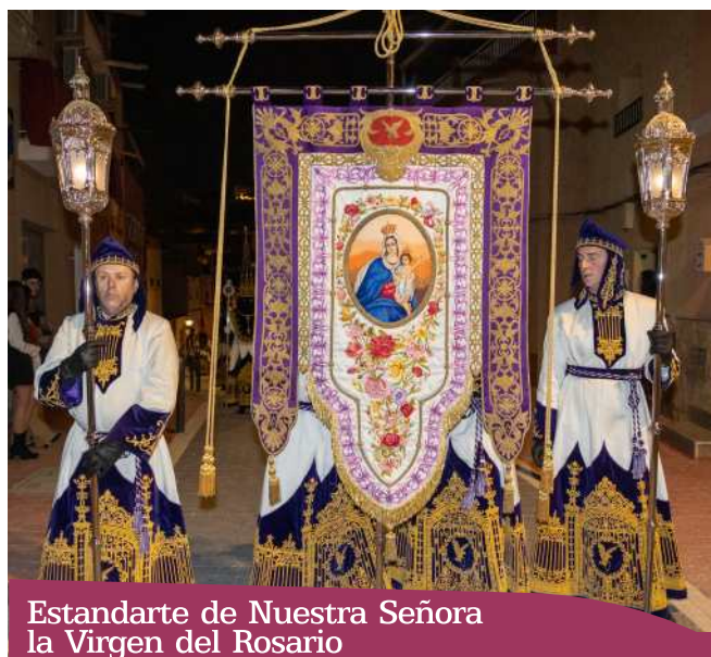
Estandarte de Nuestra Señora la Virgen del Rosario