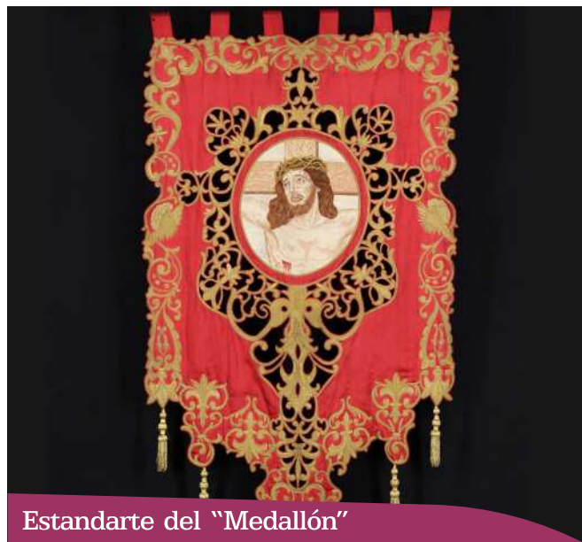
Estandarte del "Medallón"