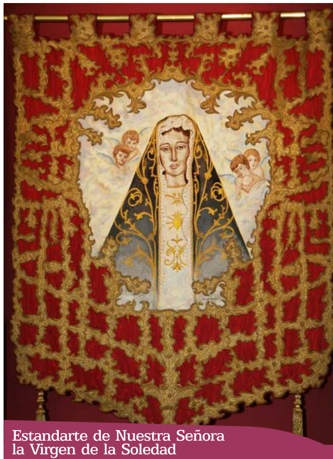
Estandarte de Nuestra Señora la Virgen de la Soledad