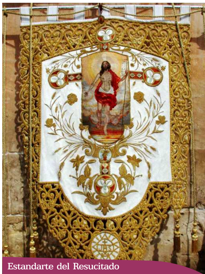
Estandarte del Resucitado

1) Procesión del Resucitado el Domingo de Resurrección.