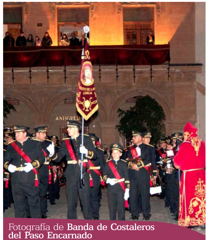
Fotografía de Banda de Costaleros del Paso Encarnado

Archicofradía del Santísimo Cristo de la Sangre. Paso Encarnado.