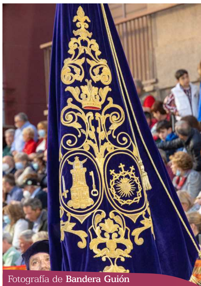
Fotografía de Bandera Guión