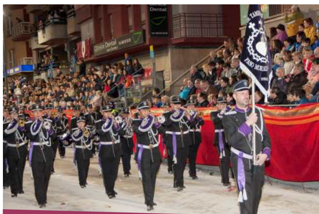
Fotografía de Banda de Música de Nuestra Señora de la Piedad

Cofradía del Santísimo Cristo del Perdón. Paso Morado. Cortejo religioso.