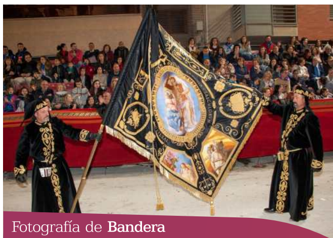
Fotografía de Bandera