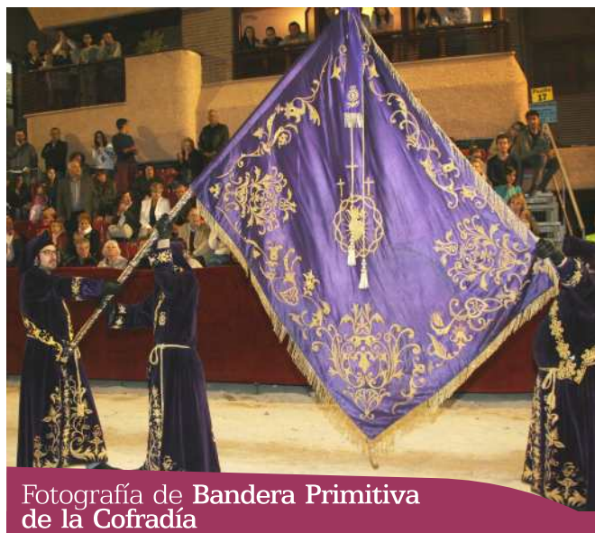
Fotografía de Bandera Primitiva de la Cofradía