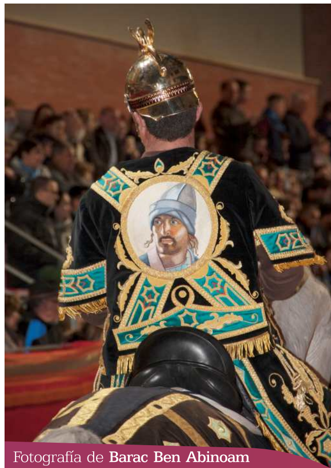
Fotografía de Barac Ben Abinoam

Representa la vuelta triunfante de la profetisa Débora, esposa de Lappidot, y Barac Ben Abinoam de la batalla de Esdrelón, sobre los ejércitos cananeos del rey Jabín (Rey de Jazor), mandados por Sísara en las postrimerías del siglo XII a. de C. Barac se distingue por llevar bordado en la espalda su propio busto; no viste manto respetando su original concepción.