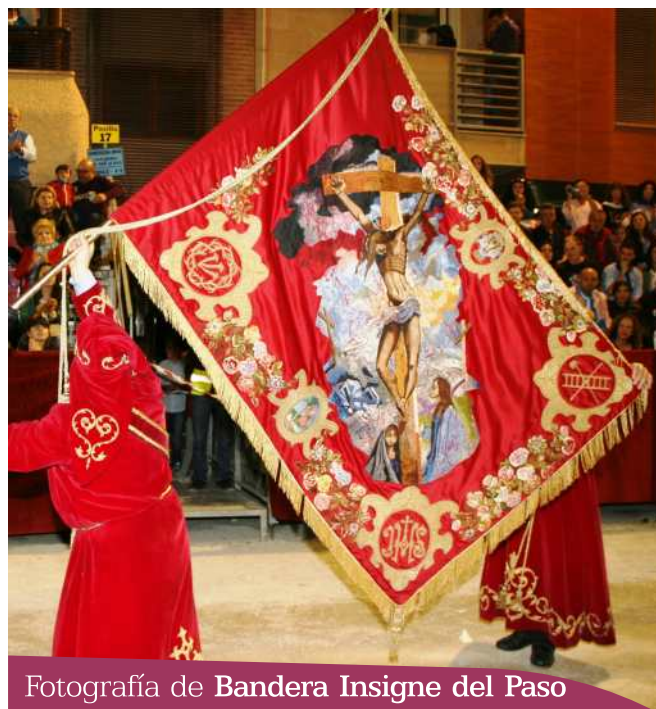
Fotografía de Bandera Insigne del Paso