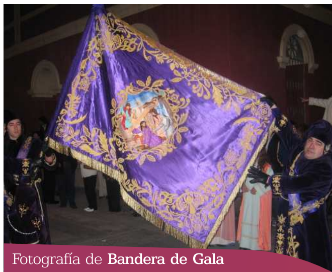
Fotografía de Bandera de Gala