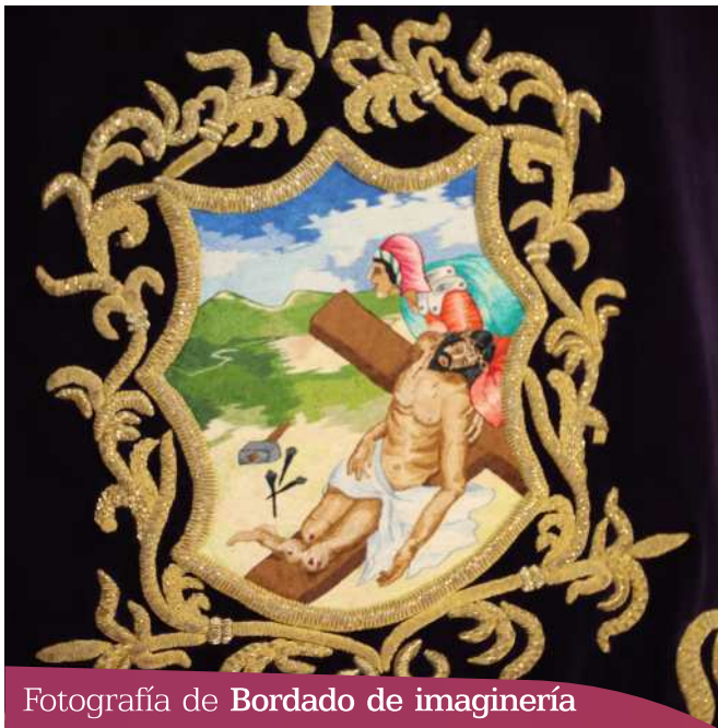
Fotografía de Bordado de imagería