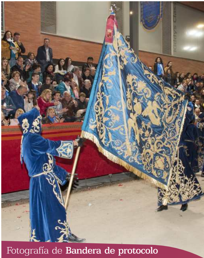
Fotografía de Bandera de protocolo