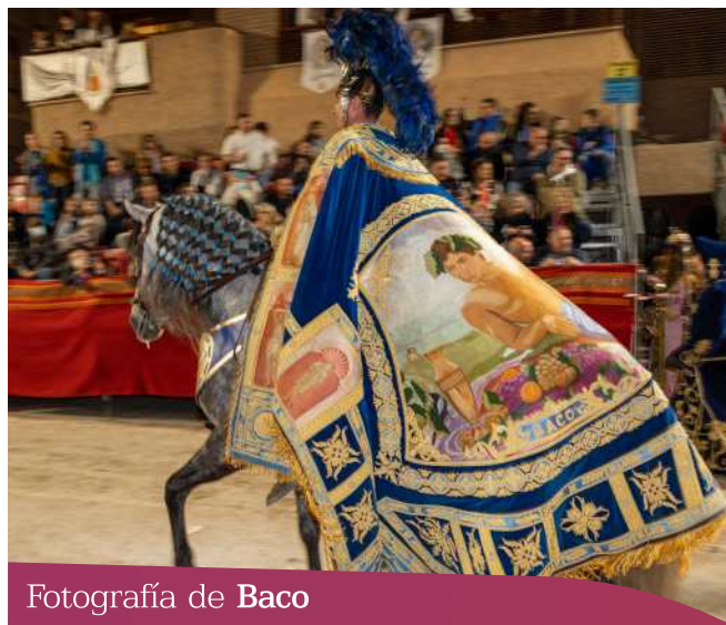
Fotografía de Baco

Se representa a Baco, el dios romano del vino