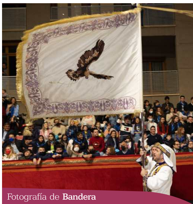
Fotografía de Bandera