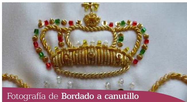
Fotografía de Bordado a canutillo

DRAE. 1. Bordado que se hace con hilo de oro o plata rizado en canutos.