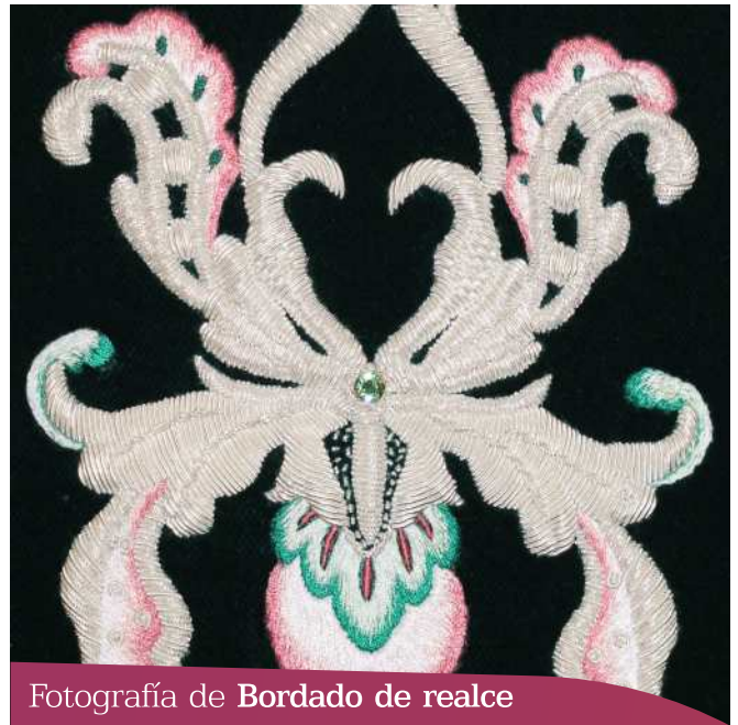
Fotografía de Bordado de realce