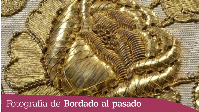
Fotografía de Bordado al pasado

DRAE. 1. Bordado que se hace pasando las hebras de un lado a otro de la tela o piel en que se ejecuta el trabajo, formando dibujos, sin cosido.