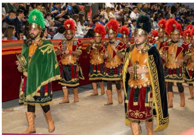
Fotografía de Banda romana de trompetas y tambores

Los trajes están inspirados en la época de Trajano.