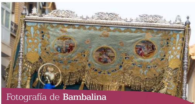
Fotografía de Bambalina

Trozo del palio que, como caída, cuelga del techo de este, realizado en ricas telas con adornos bordados; pueden estar bordadas con hilos de oro, plata, seda, tisú, etc. Son cuatro: frontal, posterior y dos laterales.