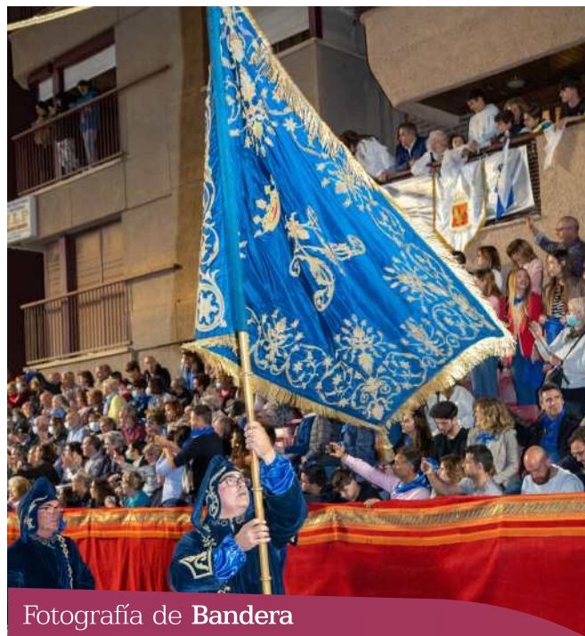
Fotografía de Bandera

1972. Se cambia el raso de la bandera bordada en 1956 adicionándole al oro bordado sedas anaranjadas.