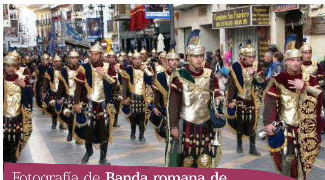
Fotografía de Banda romana de trompetas y tambores