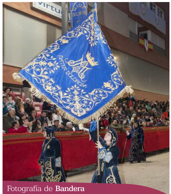
Fotografía de Bandera