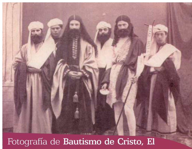
Fotografía de Bautismo de Cristo, El

1863. Hay constancia por primera vez del grupo.