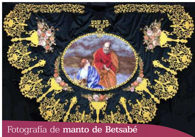
Fotografía de manto de Betsabé