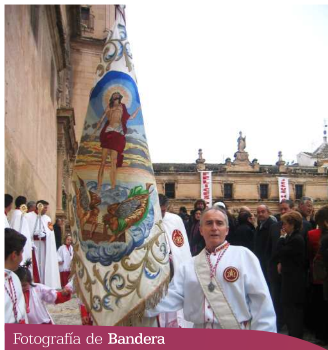
Fotografía de Bandera